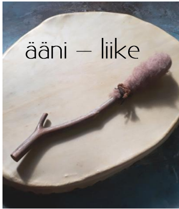
ääni – liike